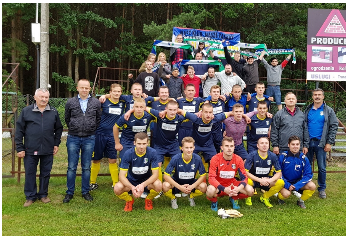
Fot. 7. Drużyna Wisanu na stadionie w Górnio świętująca wraz z kibicami awans do klasy okręgowej w sezonie 2017/2018.