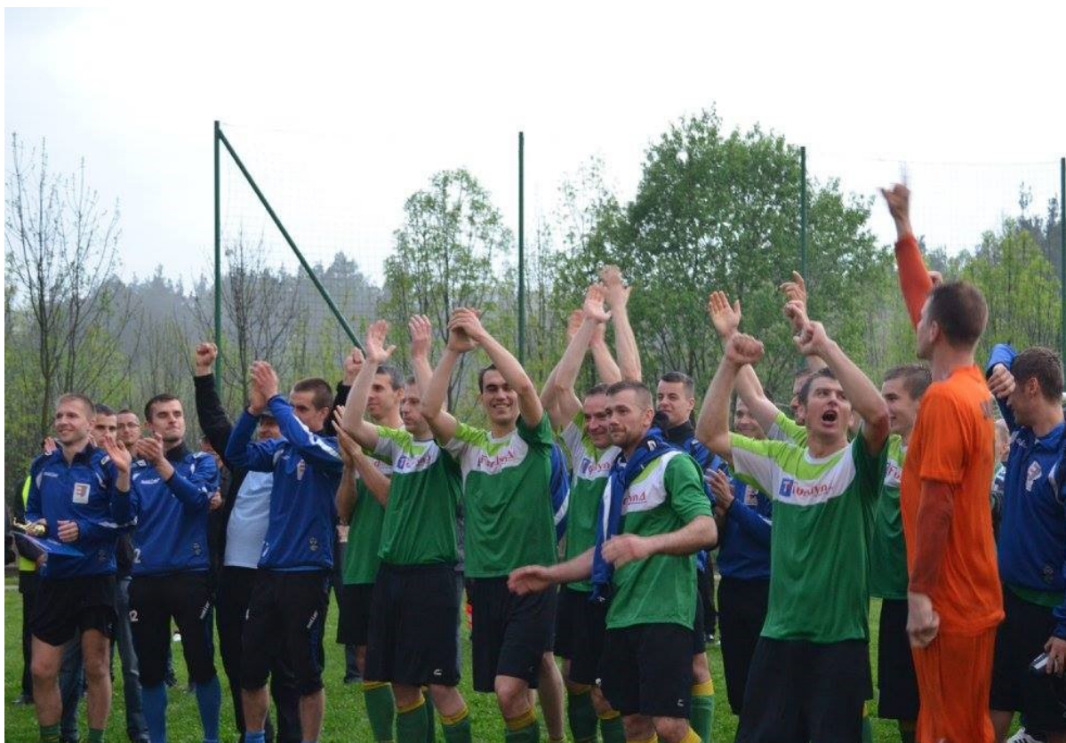
Fot. 6. Drużyna Wisanu świętująca zdobycie Okręgowego Pucharu Polski po zwycięstwie 2:1 w finale z Sokolem Sokolniki na stadionie w Sójkowej (6 maja 2015).