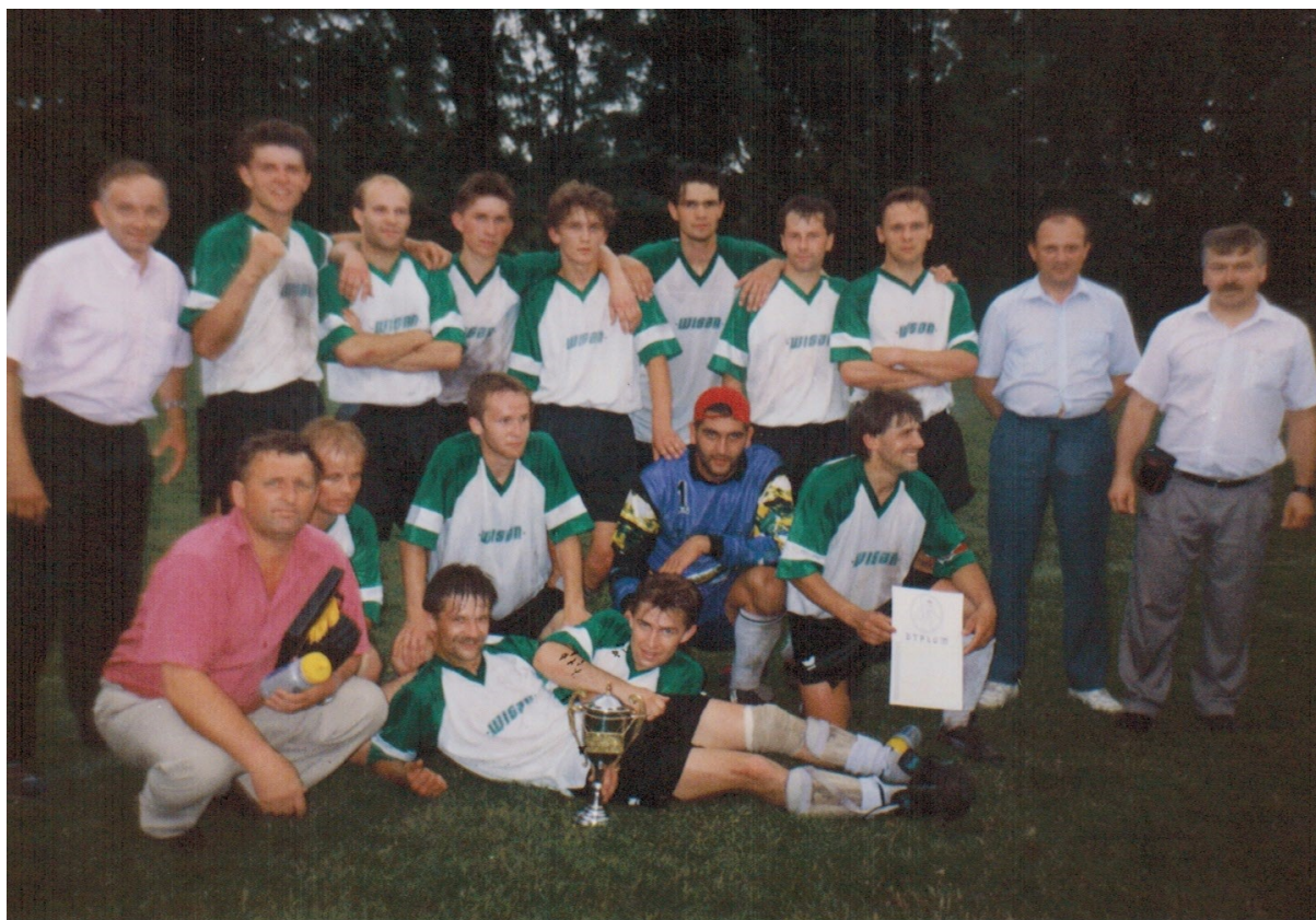
Fot. 4. Drużyna Wisanu świętująca zdobycie Okręgowego Pucharu Polski po zwycięstwie 2:1 w finale z Orłem Rudnik.