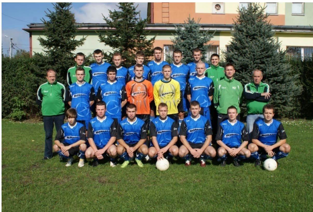
Fot. 5. Skład drużyny Wisanu w sezonie 2010/2011 zakończonym awansem do klasy okręgowej.